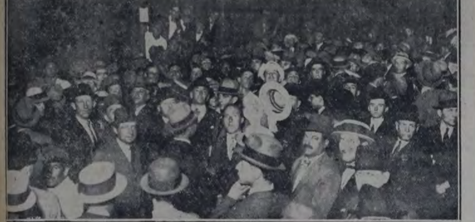
EN LA PARTE SUPERIOR SE OBSERVA A LOS VIAJEROS RODEADOS DE FAMILIARES Y amigos. En la inferior, el público que acudió a despedirlos.