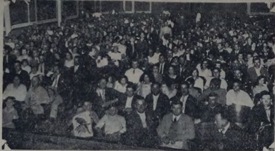
VISTA DE LA CONCURRENCIA AL ACTO DE PROCLAMACION DE LOS CANDIDATOS DE LA UNIÓN OBREROS MUNICIPALES, DE COLEGIALES

El acto final se realizará el martes próximo. Conforme se había anunciado, la Unión Obreros Municipales hizo en Colegiales la proclamación de sus candidatos a directores de la Caja municipal de jubilaciones.